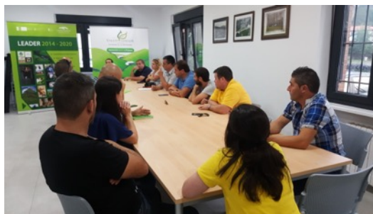
Mesa Informativa Valle del Pas. Septiembre 2018.