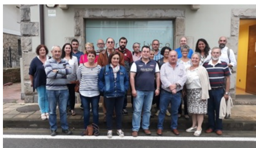
Asamblea Asociación para la Promoción y Desarrollo Valles Pasiegos. Septiembre 2018.