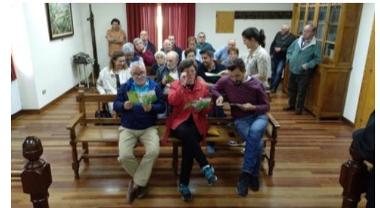
Reunión Merindad de Sotoscueva. Octubre 2018.