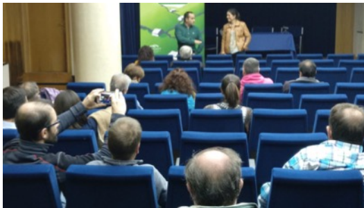
Reunión Espinosa de los Monteros. Octubre 2018.