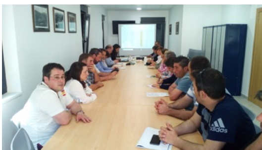
Asamblea Asociación para la Promoción y Desarrollo Valles Pasiegos. Abril 2018.