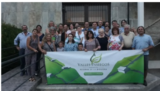
Mesa Informativa Valle de Miera. Septiembre 2018.