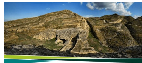
PLAN DE ACCIÓN 2014-2023 Y MEMORIA DECENAL DE LA RESERVA DE LA BIOSFERA DE LOS VALLES DEL LEZA, JUBERA, CIDACOS Y ALHAMA