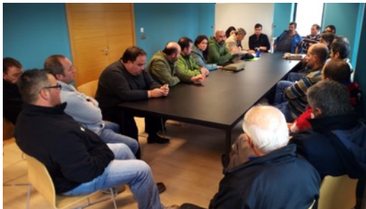
Reunión Ganaderos en Villacarriedo

Desde el lanzamiento de la propuesta de candidatura a Reserva de la Biosfera de Valles Pasiegos, se han realizado diversas reuniones con sectores socioeconómicos del territorio para informar sobre aspectos que comprende a este figura de la UNESCO y también para recabar impresiones y propuestas de actuaciones a desarrollar en una segunda fase.