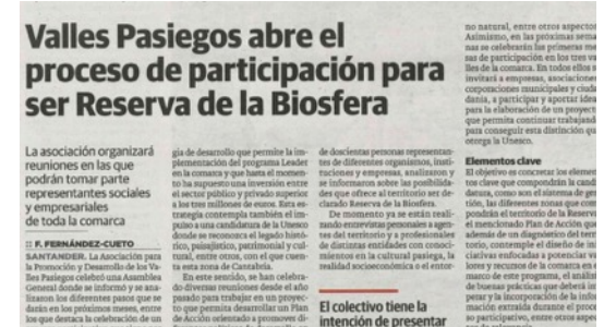
Campañas en medios de comunicación. 2017 – 2018.