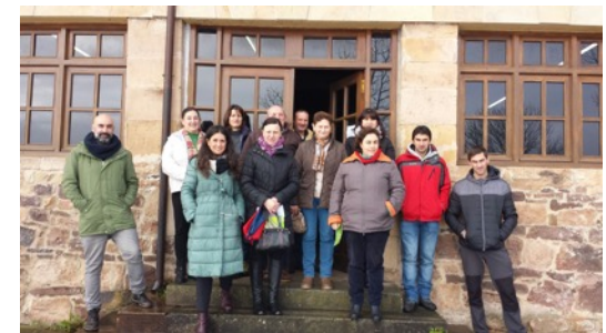
Reunión Ganaderos en San Pedro del Romeral