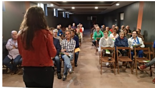
Reunión Merindad de Valdeporres. Octubre 2018.