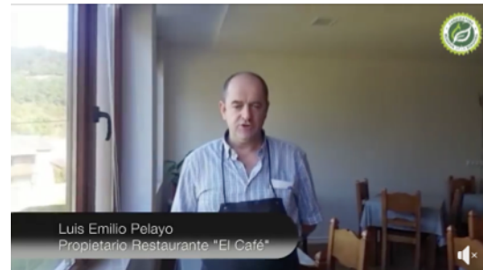
Campañas de Comunicación RRSS. Septiembre Octubre 2018.