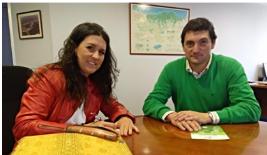
Confederación Hidrográfica del Cantábrico. Octubre 2018.