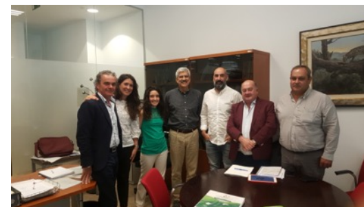
Reunión en el Ministerio para la Transición Ecológica. Octubre 2018