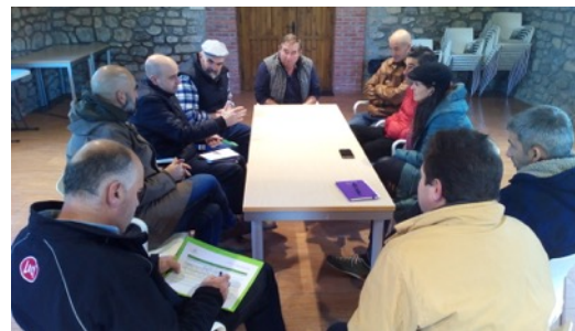
Reunión Ganaderos en Santiurde de Toranzo