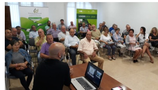
Mesa Informativa Valle de Pisueña. Septiembre 2018.